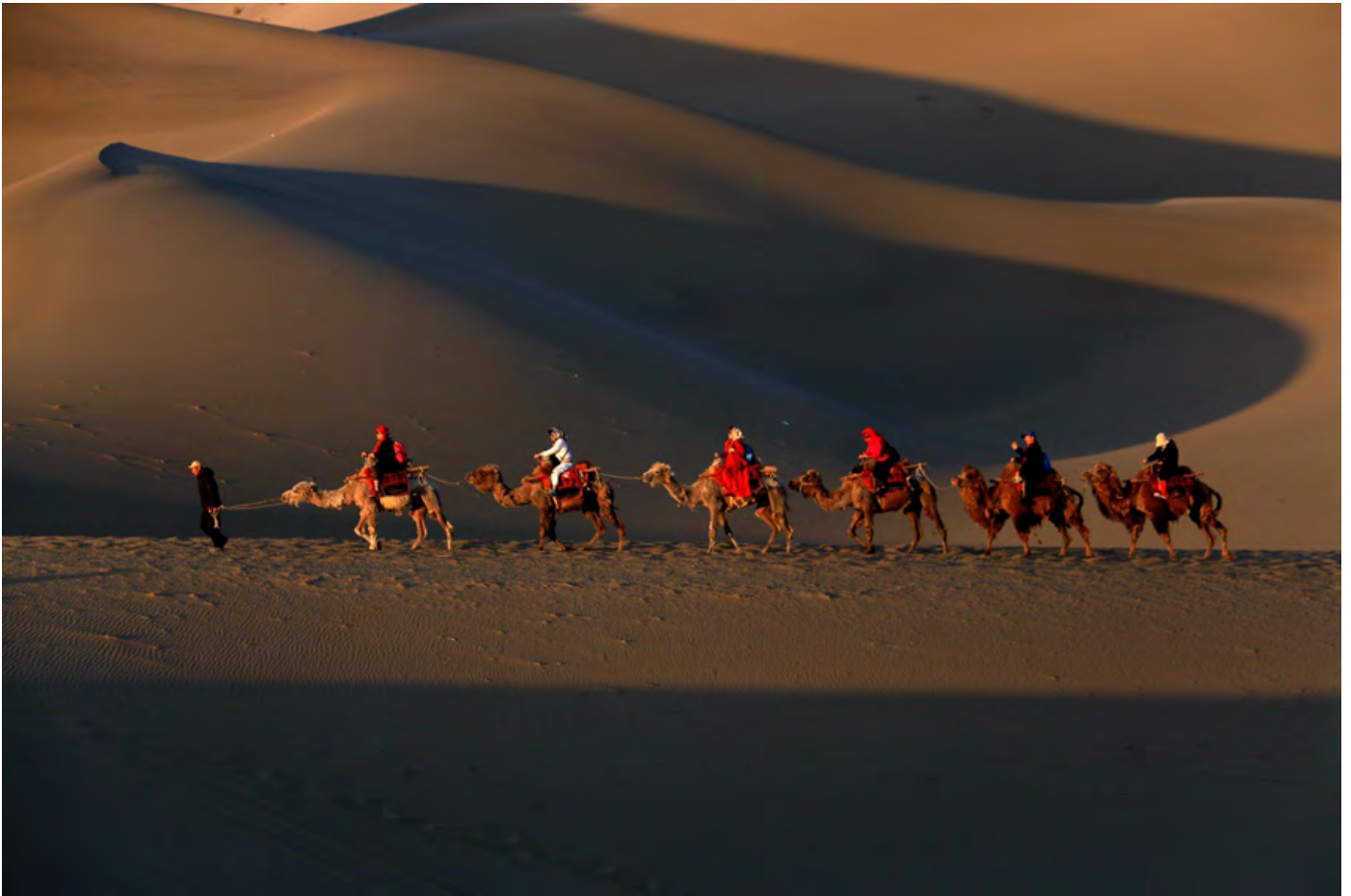
Sanddünen in Mingsha-Berg, Dunhuang China

Hat Ihnen unser Newsletter gefallen? Sollten Sie daran Interesse haben, ihn auch weiterhin mindestens einmal im Monat zu beziehen, dann können Sie ihn per Mail hier abonnieren: